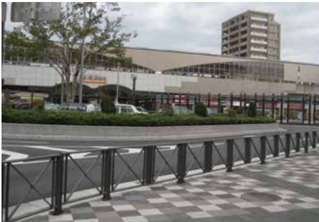
埼玉県 越谷市 越谷駅東口