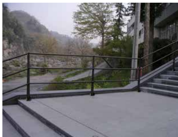
埼玉県 秩父市 長瀬町