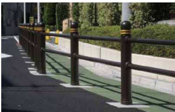
東京都 新宿区 蜀江坂