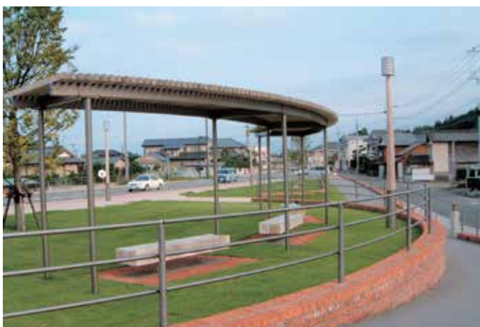
宮崎県 日向市 塩見橋橋詰