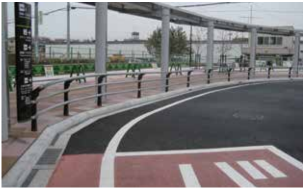
埼玉県 入間市 武蔵藤沢駅