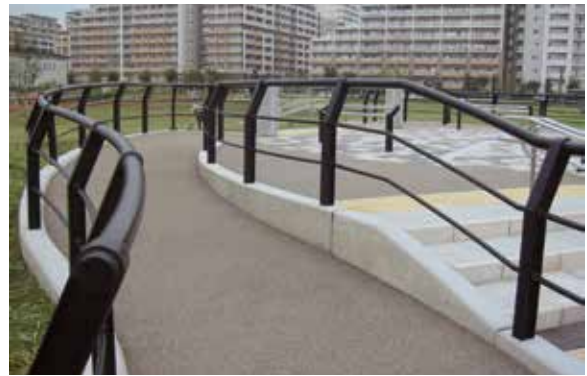
東京都 足立区 新田公園