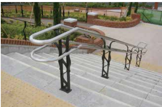
東京都 足立区 新田公園