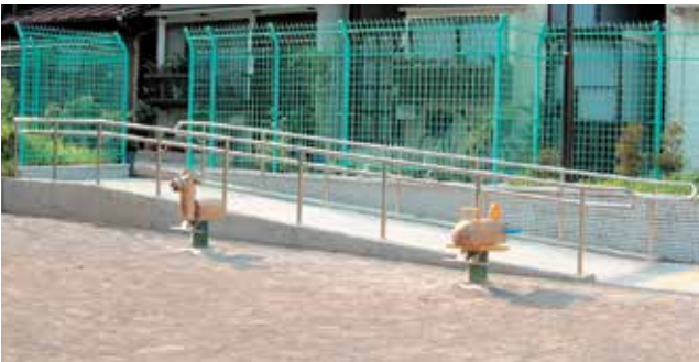
東京都 品川区 北浜公園