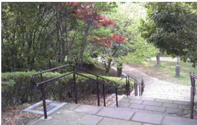
神奈川県 横浜市都筑区 くさぶえの道