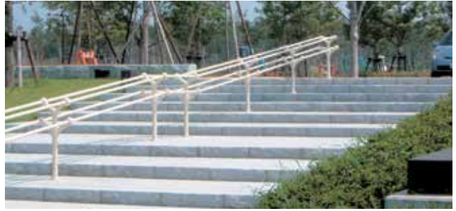
静岡県 浜松市 浜名湖ガーデンパーク