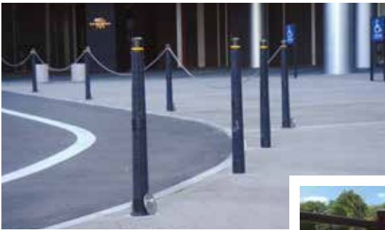
東京都 墨田区 曳船駅前