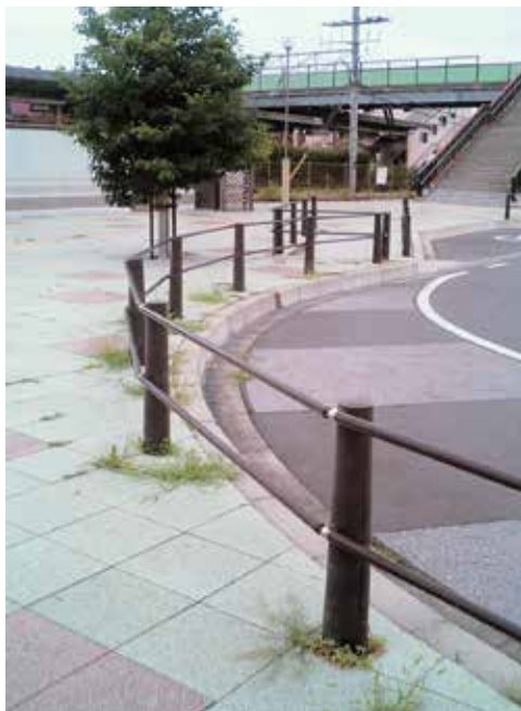
埼玉県 上里町 神保原駅