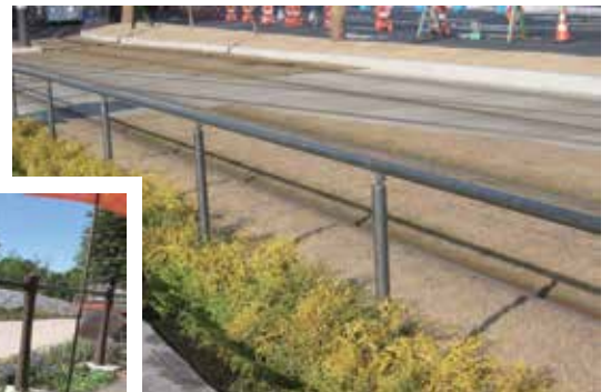
熊本県 熊本市 熊本駅前