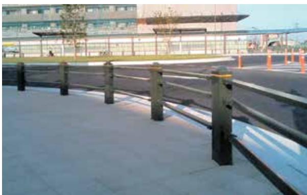
埼玉県 三郷市 三郷中央駅