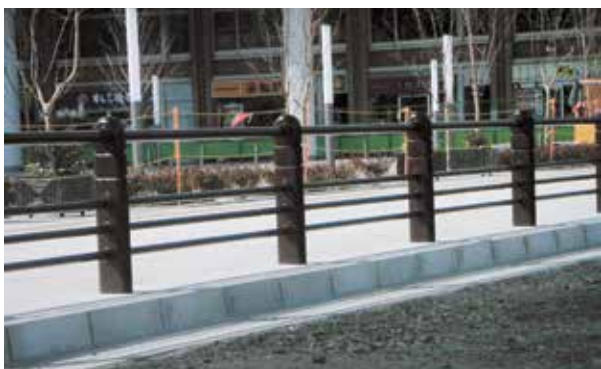
埼玉県 川口市 川口駅東口