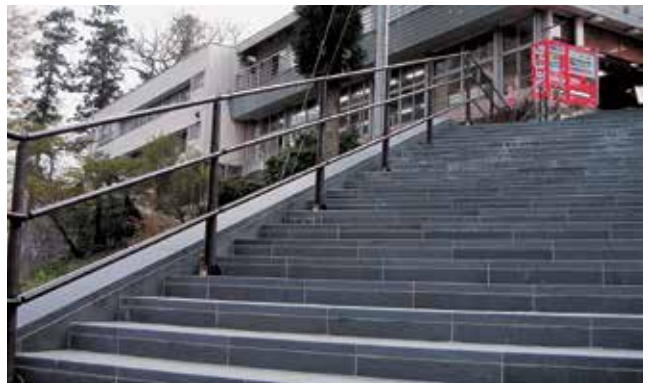
埼玉県 秩父市 長瀬町観光協会