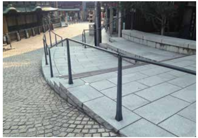
愛媛県 松山市 道後温泉本館