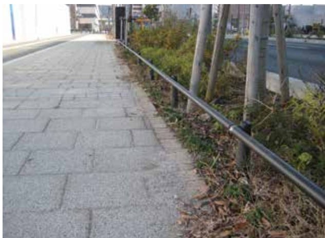
千葉県 習志野市 奏の杜