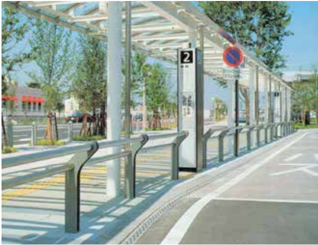
埼玉県 さいたま市大宮区 新都心駅前