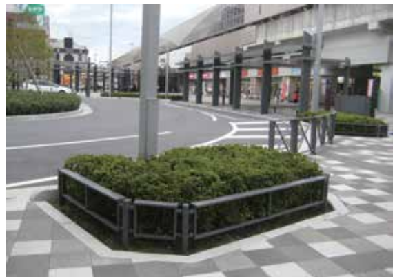
埼玉県 越谷市 越谷駅東口