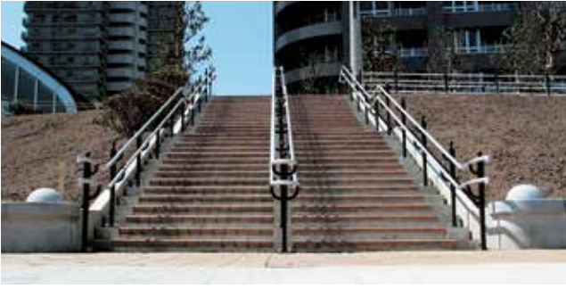
東京都 中央区 石川島公園