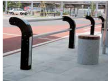
埼玉県 朝霞市 朝霞駅前