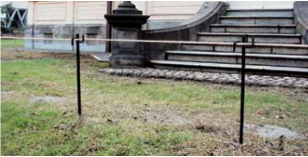
東京都 台東区 旧岩崎邸