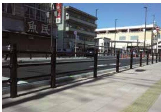
埼玉県 鴻巣市 鴻巣駅西口