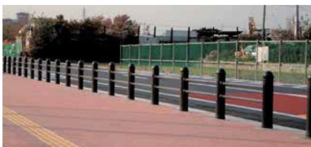
埼玉県 越谷市 しらこぼと水上公園