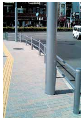
東京都 渋谷区 恵比寿駅広