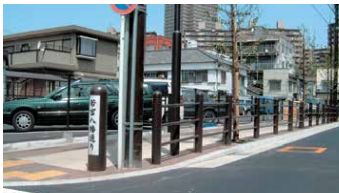
東京都 荒川区 若宮八幡通り