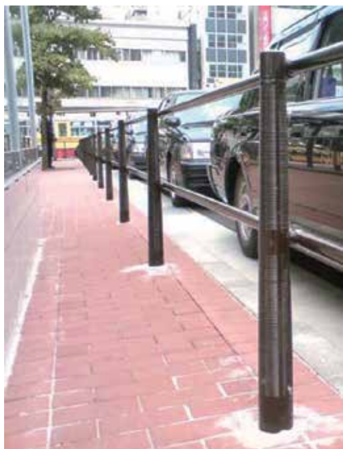
神奈川県 平塚市 平塚駅北口駅前