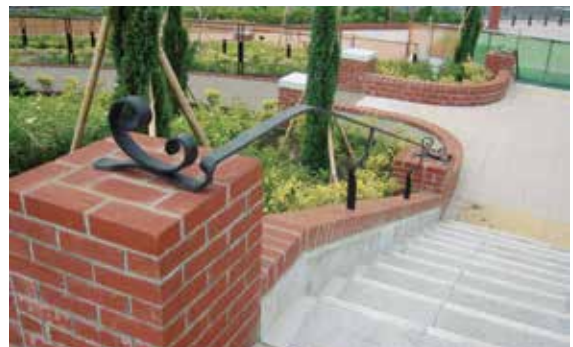
東京都 足立区 新田公園