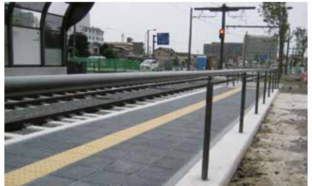
熊本県 熊本市 熊本駅