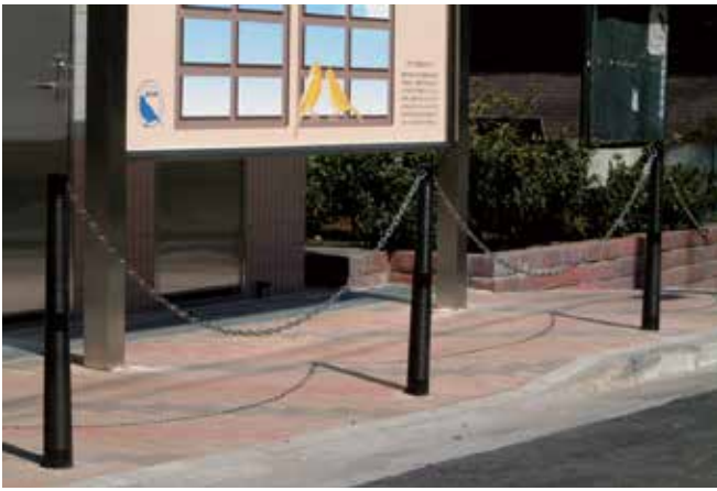
東京都 品川区 旗の台南公園