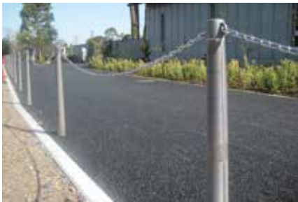
東京都 小金井市 小金井弓道場