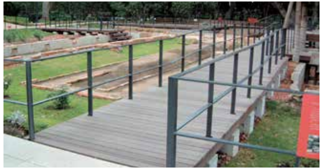
神奈川県 藤沢市 江の島植物園