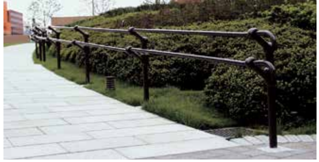
東京都 新宿区 河田町