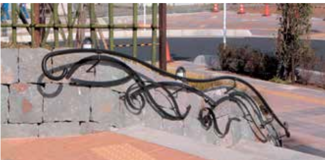
埼玉県 さいたま市浦和区 エイベックスタワー