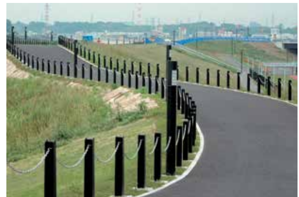
神奈川県 横浜市港北区 新横浜公園