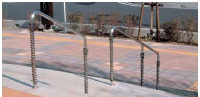
埼玉県 さいたま市浦和区 エイベックスタワー