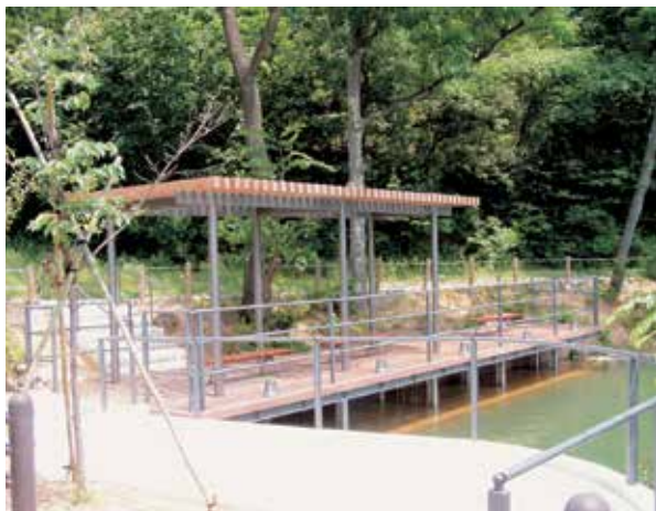
石川県 加賀市 真菰ヶ池