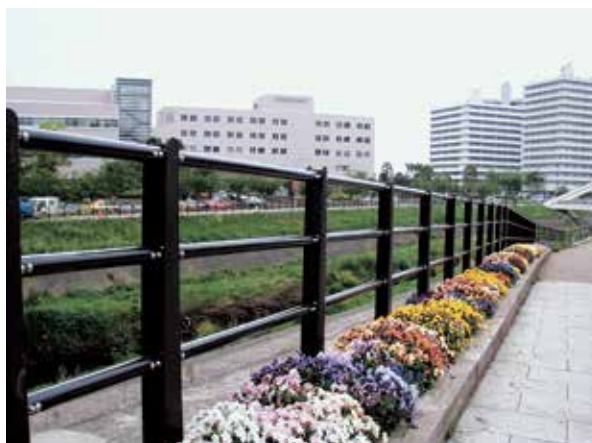
神奈川県 横浜市港北区 新横浜公園