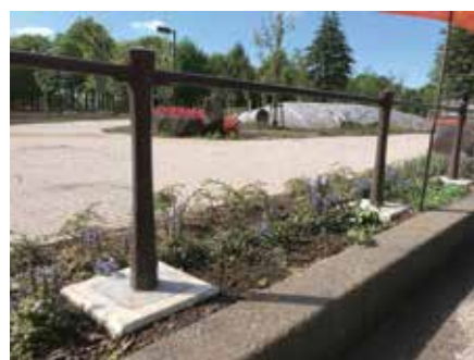
東京都 武蔵野市 中央公園