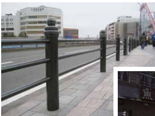
神奈川県 横浜市西区 国際橋