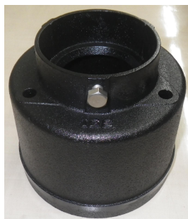
カチオン電着塗装